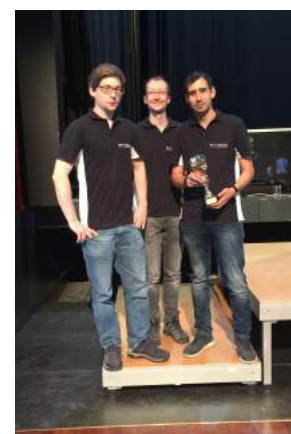
Photo 4: A gauche, première équipe suisse; au centre, Guest Champion, Team TURAG, Dresde;

À droite, les deuxième et troisième équipes suisses.