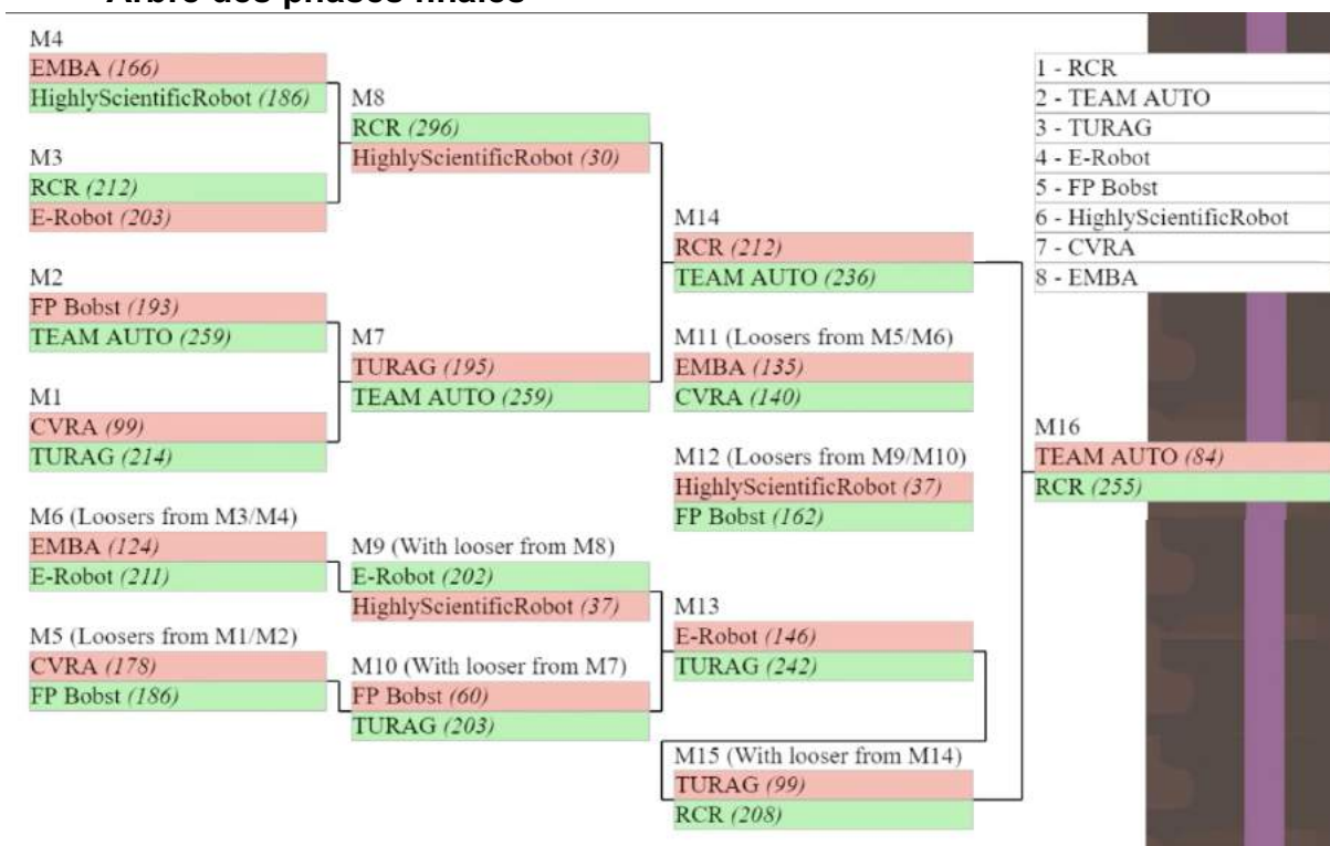
Fig.1 Résultats des 8 équipes sélectionnées à l'issue des 8 premiers rounds