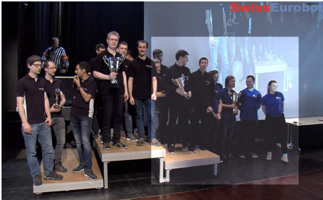
Photo 1: Les gagnants de SwissEurobot Open 2019, de gauche à droite: Team e-Robot, St-Imier (BE), Bronze Swiss Champion ; Team RCR – Roboter Club Rapperswil, Rapperswil (SG), vainqueur global de la compétition, et Golden Swiss Champion ; TeamAuto, Yverdon-les-Bains (VD), Silver Swiss Champion ; Team TURAG, Dresde, Allemagne, Guest Champion , et 3ième de la compétition suisse.